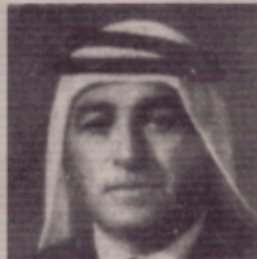
خلف الأحمد التل